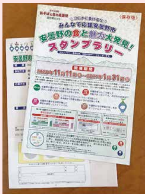
参加店舗と台紙を掲載した冊子

スタンプラリー実施期間は令和2年11月11日から令和3年1月31日まで、その後スタンプラリー参加店と商工会飲食分科会員のお店で使える商品券等が当たる抽選会を行って参ります。