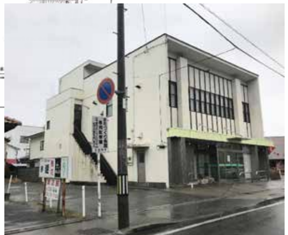
豊科まちづくり会館の全景（現在）