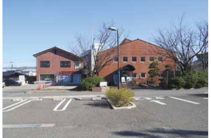
西側から見た穂高商工会館④と改修中の建物⑤の全景