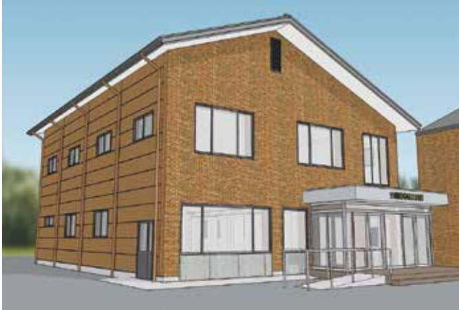
改修工事中建物の完成予想図

穂高商工会館隣倉庫の改修工事の状況は、当初の予定より2カ月程度遅延しておりますが、工事契約期間の12月25日までは、建物の本体工事及び周辺の外構工事が終了する見込みです。なお、外構工事につきましては、当初、穂高商工会館南側の緑地を駐車場として整備する計画でしたが、穂高商工会館と新しい建物との連携や周辺環境を考慮し、穂高商工会館北側樹木の伐採や駐輪場を取り壊して整備することとしました。