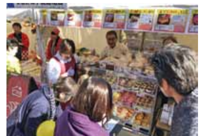
やさいスイーツの販売ブース