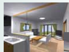
LDK デザイン イラスト

手配できる職人も大工・内外装から造園まですべての分野の職人が揃って幅広く対応できますので、ご自宅の新築・リフォームをお考えの際は気軽にご相談ください。