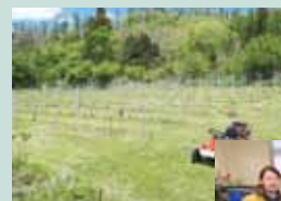
明科天王原の ぶどう畑

営業時間 9～15 時 定休日 不定休 ☑ Mail:info@le-milieu.co.jp