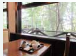
森林の囲まれた店内で…