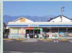
広い駐車場完備の店舗