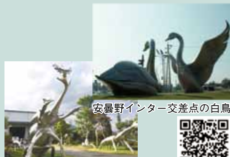
安曇野インター交差点の白鳥

世界で唯一といわれるステンレス巨大彫刻を間近で体験しにアトリエにお越しください。(要連絡)