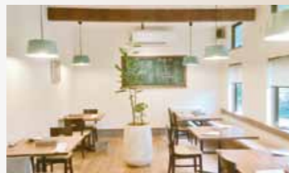
テーブル席をご用意しています

現在フェイスブックページ「Bistro NORI ビストロ ノリ」にて情報発信中です。