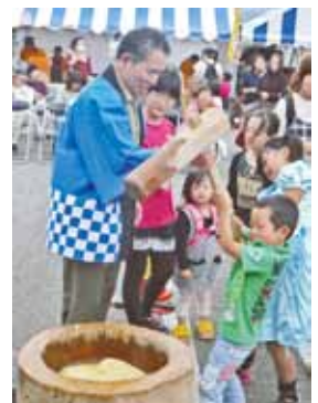
子ども達も参加してのきび餅つき（昨年の様子）