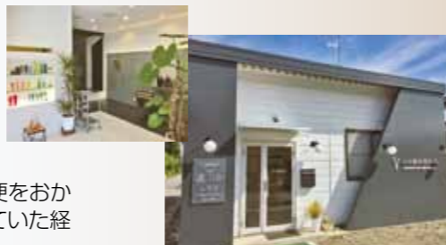
店舗は商工会堀金支所近くです

営業時間 平日10:00～19:30 土日祝9:00～18:30 毎週月曜日定休