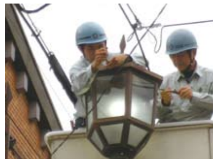
LED化へ取り付け作業

LED化により従来の水銀灯から、大幅な電気料の削減、管理の軽減効果が見込め、街路灯管理の改善と維持に向け、商工会の負担にて実行をしています。施工にあたっては建設業部会電気工事分科会、商業部会、各街路灯管理団体の協力を得ての工事です。会員各位のご理解をお願いいたします。本会としましては、平成25年度も引きつづき街路灯の改善にむけた事業実施を計画しています。