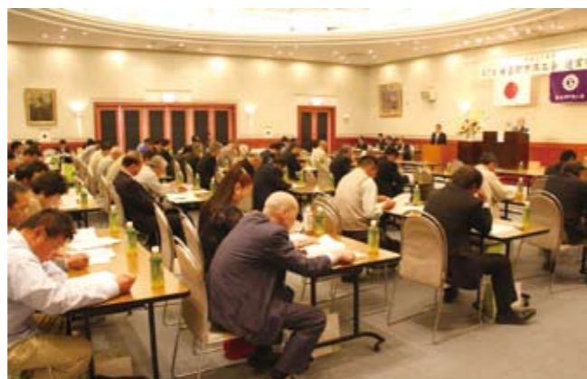
議案の慎重審議がされる