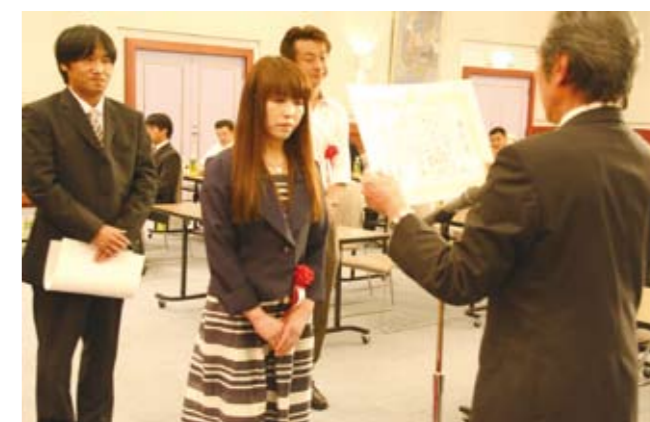
永年勤続従業員表彰