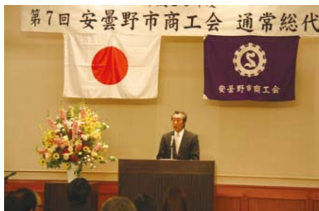
総代会開催にあたり会長の言葉